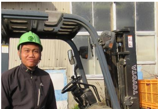
Rio san (အမှတ်စဉ် (၂) ရရှိထားသူ)

[နိုင်ငံခြားသားဝန်ထမ်းများအား အင်တာဗျူး]